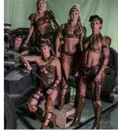
図5 『スーサイド・スクワッド』におけるアマゾネス