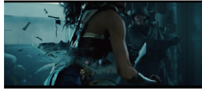
図6 戦闘シーンにおけるダイアナのクロスアップ