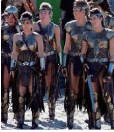
図4 『ワンダーウーマン』におけるアマゾネス